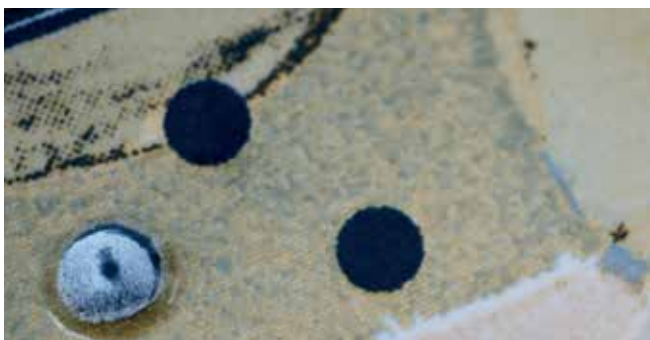
Strukturierte, widerstandsfähige Bodenfliesen, gedruckt mit SEFAR® PA 61/155-60W

SEFAR® PA ist das optimale Gewebe bei der Verwendung von hoch abrasiven Farben und für den Druck auf unebene Oberflächen: z.B. für den Druck auf Fliesen, Kunststoff- oder Glasbehälter.