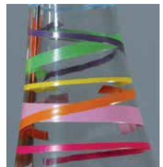
Hochdichte Farbtöne und scharfkantige Konturen, gedruckt mit SEFAR® PA 100/255-38Y