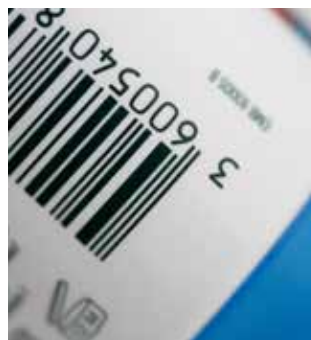
Hochdichte, kantenscharfe Barcodes, gedruckt mit SEFAR® PA 140/355-30Y